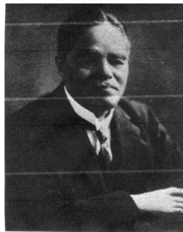
Kanzo Uchimura. 内村鑑三

今回閲読している吉田撰氏所蔵資料の中に、高木謙次による18頁に及ぶ論稿「内村鑑三と吉田源治郎」がある。これは「内村鑑三研究」第36号（2002年12月、キリスト